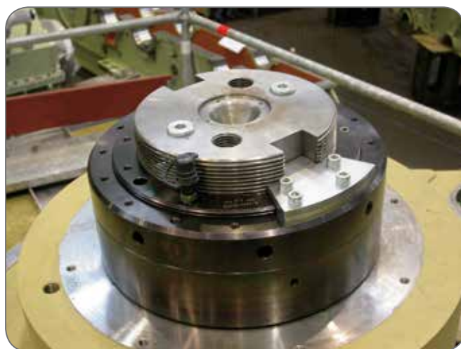
Dado idraulico per accoppiamento albero pala - timone.

Il sistema si compone di una serie di pompe a leva a 1500 bar per l'alimentazione della ghiera stessa e della superficie conica dell'albero.