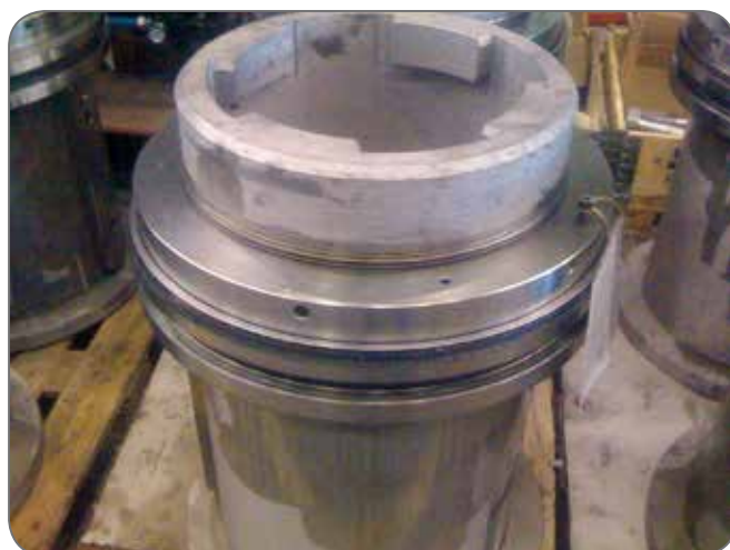
Ghiera idraulica da 60 ton filettatura Tp460x6.

Garantisce elevati sforzi in ingombri ridotti.